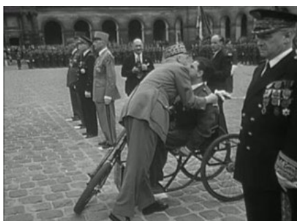
Illustration IV : Remise de médaille à un mutilé de guerre, INA, Les Actualités françaises , AFE85004606, 16 juin 1952, 04:12.

Outre la posture somatique contrôlée, les mutilés de guerre portent de manière ostentatoire l'attribut indispensable de leur corps-parade : leurs médailles. Elles symbolisent la reconnaissance nationale et donnent sens à la marque corporelle de l'acte guerrier qu'est la mutilation : en cela, elles distinguent le mutilé de guerre de l'infirme civil. Le 16 juin 1952, le commentateur porte le discours officiel de l'économie morale de la reconnaissance : « Pour demeurer fidèle à l'esprit de cette distinction, un simple soldat a été décoré aux côtés de trois généraux 23 . » En l'occurrence, ce simple soldat est un grand mutilé, qui reçoit la médaille assis dans une voiture d'invalides, mais aligné avec les autres récipiendaires. Son corps abîmé s'est ainsi vu apposer la marque du héros. Cette scène souligne l'intérêt des Actualités françaises – porteuses du regard officiel – dans la représentation du corps mutilé décoré, puisqu'elles ne montrent pas la remise de médaille des autres récipiendaires : c'est un acte important à représenter, qui s'inscrit dans un discours de reconnaissance que partagent la population française et, a fortiori , les spectateurs des Actualités .