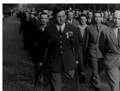
Illustration Vb : Panoramique verticale d'un mutilé qui défile, INA, Les Actualités françaises , FE85002502, 15 mai 1947, 05:56.