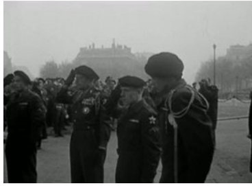
Illustration III : Un mutilé de la guerre de Corée salue, INA, Les Actualités françaises , AFE85004448, 28 février 1952, 00:48.

aussi droit et salue comme les autres, témoignant d'une remarquable maîtrise corporelle.