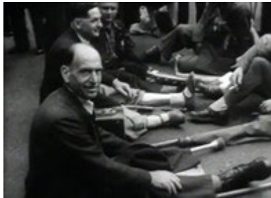
Illustration VI : Des mutilés exhibent leur prothèse pour manifester, INA, Les Actualités françaises , AFE85003594, 29 juin 1950, 00 :47.

Ainsi, les manifestations sont l'occasion pour les mutilés de se réapproprier leur corps en l'exhibant en signe de protestation. Ce phénomène n'est pas nouveau en Occident, comme le montre James McAleer avec la manifestation de mutilés agitant leurs prothèses en l'air en 1945 à Washington D.C. pour en réclamer de meilleure facture 29 .