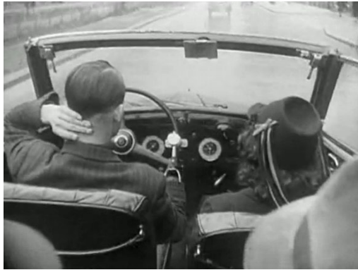
Illustration IIa : Conduite d'une voiture avec une prothèse, INA, Les Actualités françaises , FE85002394, 13 mars 1947, 4:44.

le siège passager 17 : conduire en étant mutilé du bras grâce à une prothèse est une performance, une démonstration de réadaptation réussie et de virilité. La performance virile est un objectif du processus de réadaptation, comme le montrent des mutilés qui apprennent à monter sur une échelle avec une jambe de bois en octobre 1945, accompagnés par des infirmières 18 .