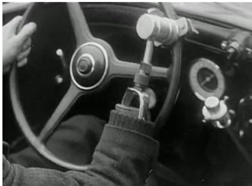
Illustration II b : Conduite d'une voiture avec une prothèse, INA, Les Actualités françaises , FE85002394, 13 mars 1947, 4:48.

À l'écran, ce sont donc des mutilés (ré) adaptés ou en cours de réadaptation qui sont projetés, (ré) incarnant un idéal viril et valide.